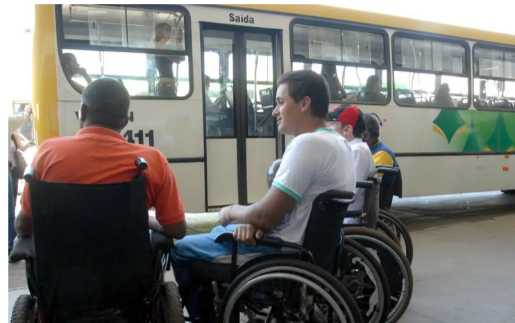
Após 8 anos, país volta a discutir direitos de PCDs em conferência

Começou neste domingo (14), em Brasília, a quinta edição da Conferência Nacional dos Direitos da Pessoa com Deficiência, que volta a ser realizada no país após um hiato de 8 anos, em 2016