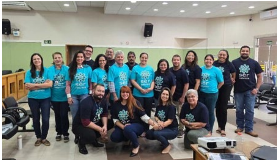
Ser Natureza, em Acreúna, promoverá ações de proteção dos mananciais de abastecimento do município