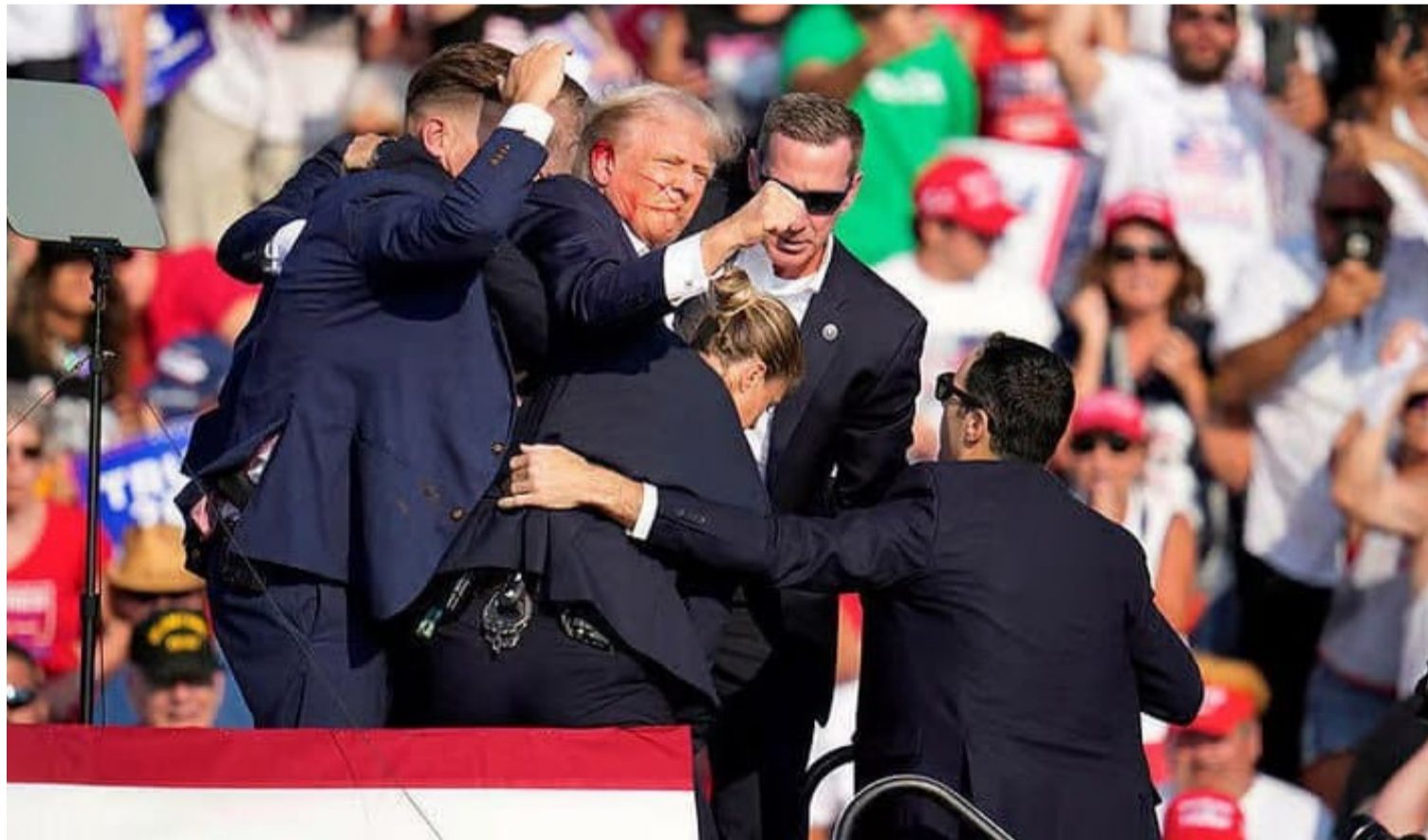
Trump foi rapidamente retirado do local, com sangue visível ao redor da orelha direita, e levado a um hospital, recebendo alta horas depois

Thomas Matthew Crooks, o atirador identificado no atentado contra Donald Trump, era um jovem de 20 anos residente em Bethel Park, Pensilvânia, aproximadamente 56 km ao sul do local do comício. O suspeito de atirar durante um comício do ex-presidente Donald Trump possuía material explosivo em seu carro e residência. Formado na Bethel Park