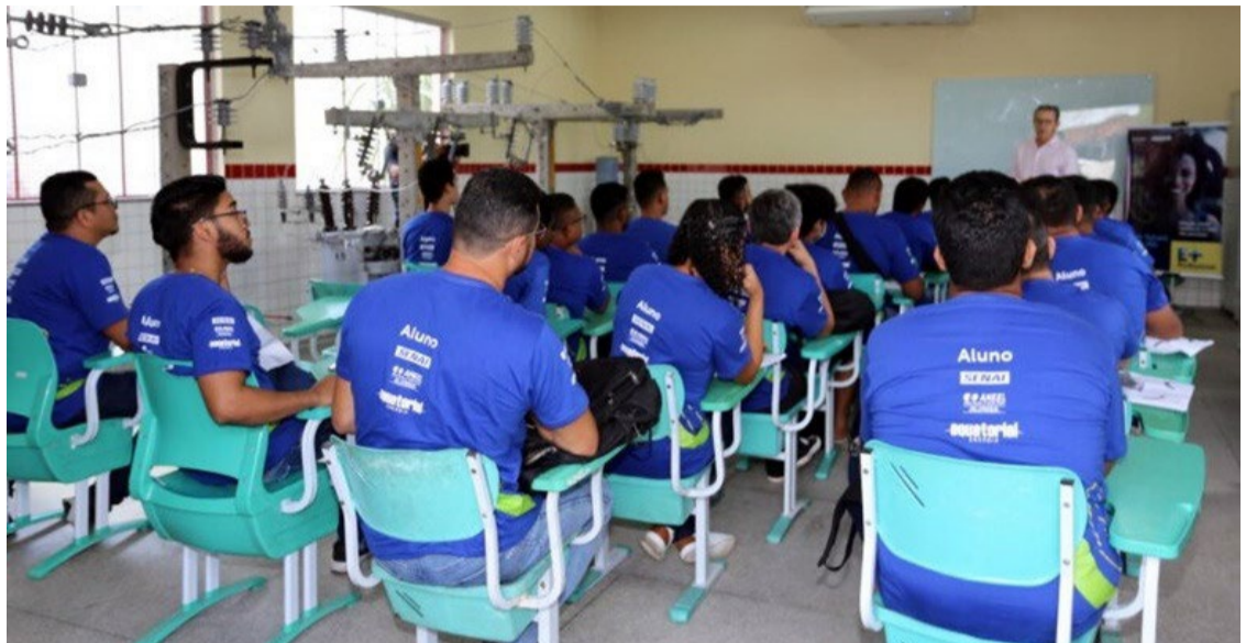
Jataí e Rio Verde: prazo de inscrição para Escola de Eletricistas termina nesta segunda, 15

O curso tem carga horária de 480 horas, além de 112 horas de curso comportamental, considerado um dos principais diferenciais do programa de qualificação profissional da distribuidora. Alguns dos assuntos abordados em sala de aula incluem raciocínio lógico, comunicação, relacionamento interpessoal e estruturação do