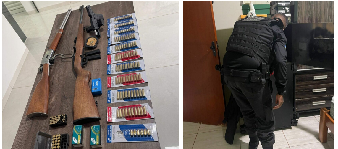
A Polícia Civil apreendeu armas e munições em Chapadão do Céu, durante investigação de violência doméstica

Foram apreendidos uma pistola, uma carabina, um rifle e 325 munições. Todas as armas estavam corretamente registradas em nome do investigado e foram apreendidas apenas como proteção acessória à mulher vítima de violência doméstica por razões da condição de gênero.