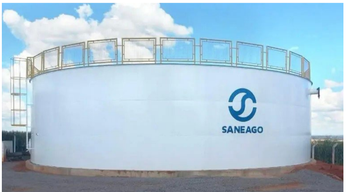
Manutenção dos reservatórios de água em Rio Verde: trabalhos vão iniciar às 7:30 e encerrar às 17h30; retorno do fornecimento será gradual

A higienização dos reservatórios é um serviço periódico essencial para garantir a qualidade da água tratada distribuída à população. A recomendação da Saneago, é que os moradores moderem o consumo das reservas domiciliares de água tratada durante o período de desinfecção.