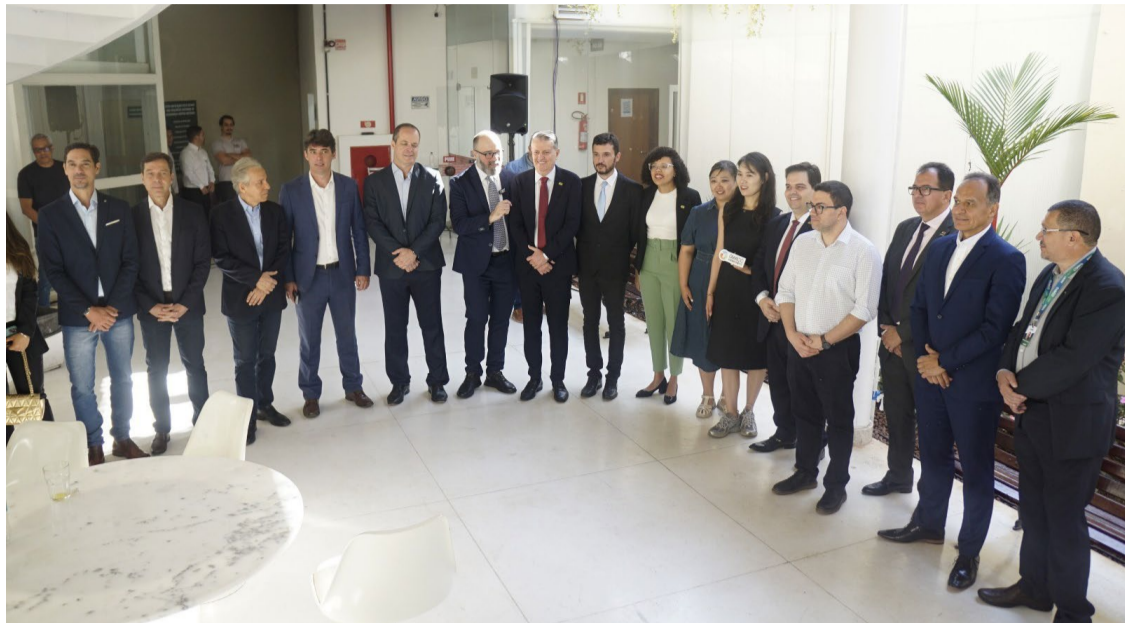
Jornalistas da comitiva chinesa que está em visita a Goiás solicitaram entrevista a fim de aprofundarem os conhecimentos sobre o estado - Foto: Ana Flávia Marinho/Seapa.

Rezende também lembrou que a China é o principal destino das exportações de Goiás, e apontou a importância da parceria comercial para a obtenção do resultado da balança comercial de Goiás, que superou a marca de 3,6 bilhões de dólares de superávit no período de janeiro a junho de 2024. “É