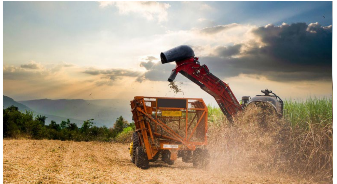
As exportações do agronegócio brasileiro atingiram US$ 15,20 bi em junho e US$ 82,39 bi no semestre — Foto: Reprodução.

Neste período, os cinco principais setores do agronegócio brasileiro se destacaram significativamente nas exportações. O complexo soja liderou, alcançando US$ 33,53 bilhões, representando 40,7% do total exportado pelo agronegócio. Em seguida, o setor de carnes exportou US$ 11,81 bilhões, equivalentes a 14,3% das exportações do agronegócio. O complexo sucroalcooleiro registrou US$ 9,22 bilhões, correspondendo a 11,2% do total,