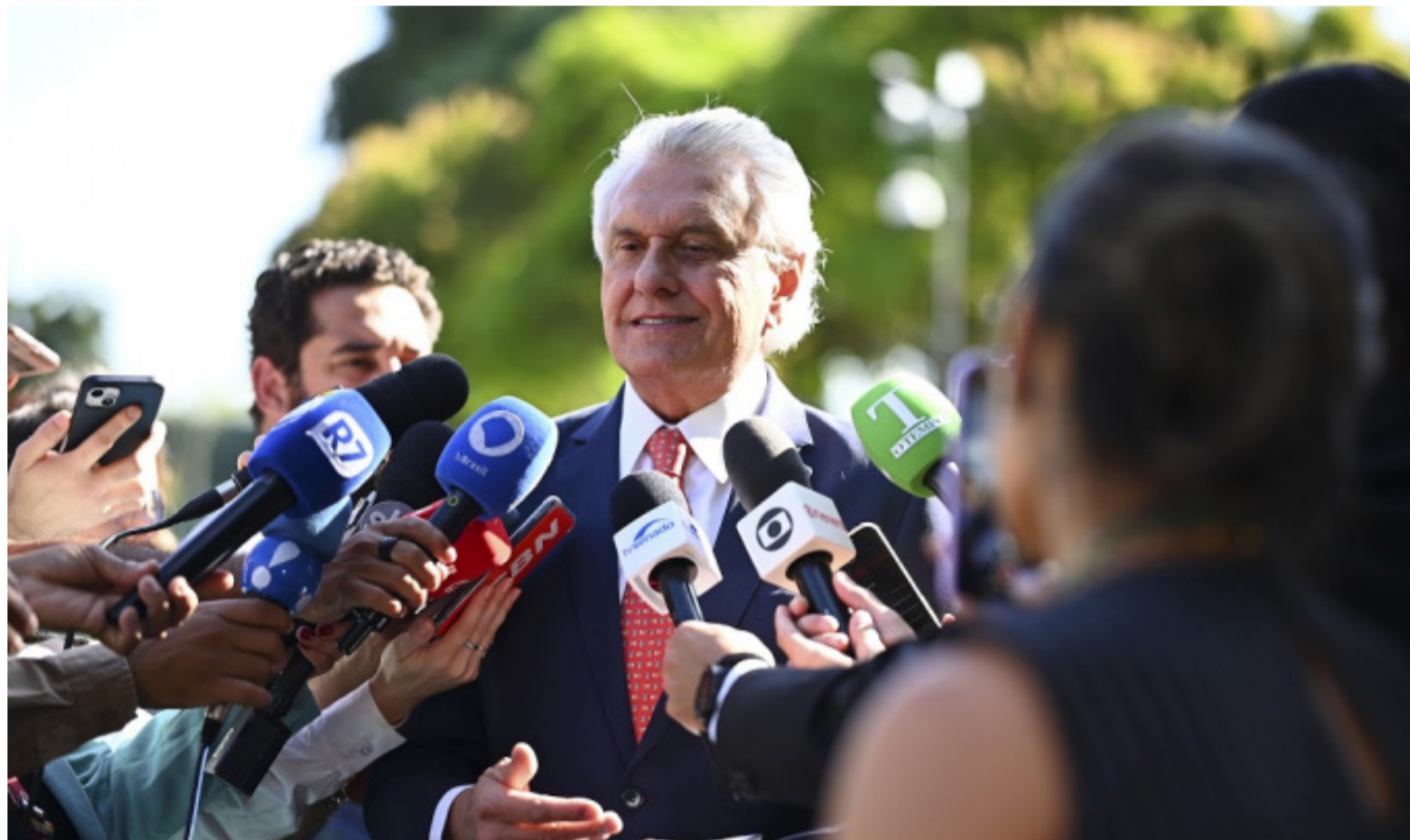
Ronaldo Caiado: busca de amplo apoio para concorrer, pela segunda vez, ao Palácio do Planalto

O governador diz que não descarta a possibilidade de Bolsonaro reverter sua inelegibilidade e de concorrer ao próximo pleito presidencial, mas diz que, caso essa hipótese não se confirme, suas credenciais