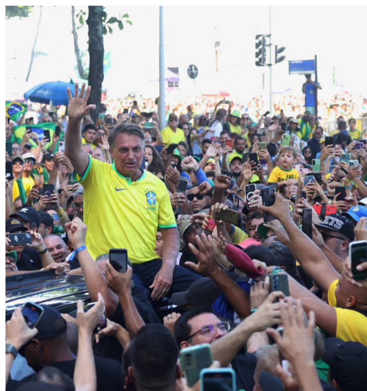
Jair Bolsonaro: visita aos municípios para reforçar pré-campanha do PL