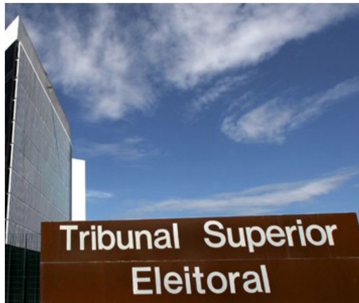
TSE: dúvidas sobre regras para utilização das redes sociais durante as eleições de 2024