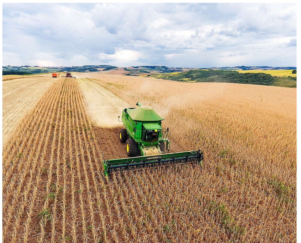
A Safra de soja 24/25 acima de 170 milhões de t. é estimada por consultoria — Foto: Reprodução.

Após uma temporada de perdas no Rio Grande do Sul e no Paraná, os produtores têm o desafio de semear uma nova safra diante da possibilidade crescente de um novo La Niña.