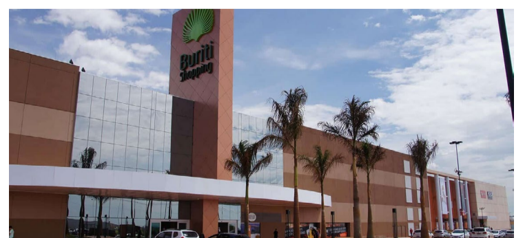
Atividades especiais de férias no Buri Shopping vão acontecer até o dia 27 de julho — Foto: Reprodução.

sados devem acessar o aplicativo do Buri Shopping Rio Verde, cadastrar as notas fiscais no programa "Tem Vantagem", resgatar o cupom no próprio aplicativo e apresentar o código gerado no espaço da programação. As inscrições iniciam nesta segunda-feira, 15. As atividades estão acontecendo no piso térreo, próximo à loja Riachuelo.