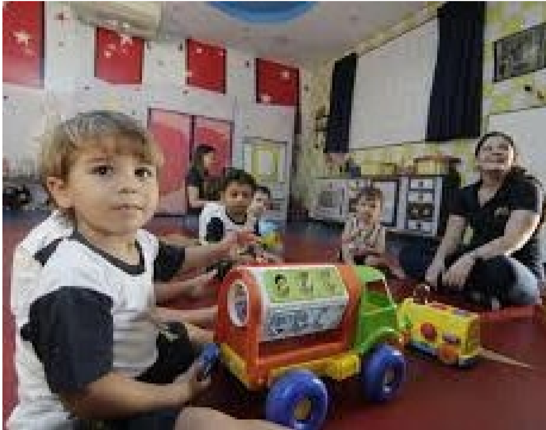
Brinquedoteca é a alegria das crianças quando os pais frequentam bares, restaurantes, shoppings e outros ambientes

Famílias goianienses em geral entendem que as brinquedotecas representam itens de segurança com a criançada se divertindo nos brinquedos e jogos