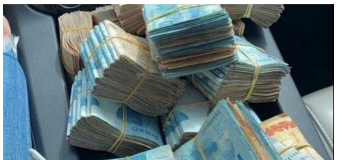
Danos morais: Motorista em Rio Verde será indenizado por ter que transportar dinheiro sem ter treinamento específico — Foto: Reprodução.

O magistrado ressaltou que a Lei nº 7.102/1983 determina que o transporte de valores deve ser feito com a presença de dois vigilantes treinados. No